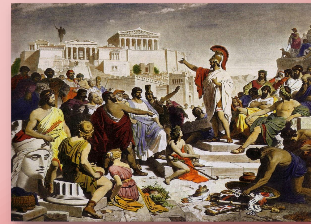
Fig. 2: Discurso fúnebre de Pericles , de Philipp von Foltz,

También, hemos comenzado una fase de exposición de la investigación lograda en la etapa 2019-2020 dentro del proyecto de SeCTyP, que será complementado en la etapa 2020-2021 con la traducción e interpretación de otras fuentes primarias que bosquejan el contexto histórico de Lisias, provenientes de cronistas griegos recopilados por el helenista Felix Jacoby.