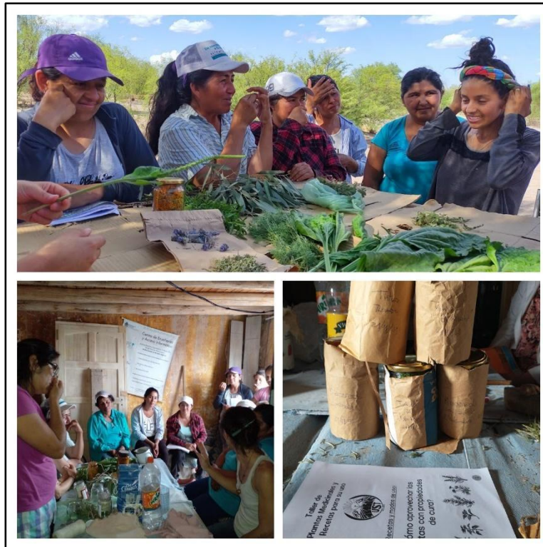
Imagen 1 Registros del Taller de Cosmética Natural realizado en Lagunas del Rosario en octubre de 2021. (Fuente: propia).