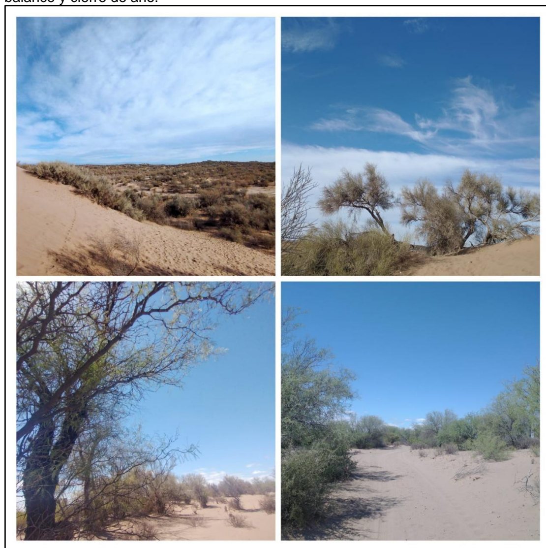
Imagen 2 Las imágenes superiores fueron tomadas en los alrededores de la casa de Rosaura (localidad del Cavadito), mientras que las inferiores fueron captadas en las proximidades del SUM de la organización (localidad de San Antonio).

Nuestro encuentro, el cual pude grabar y al cual pude llegar gracias a la coordinación con Vero, integrante de la CyT, se dió en el salón que posee la organización en San Antonio, Lagunas del Rosario, luego de que la organización tuviera una reunión de balance y cierre de año.