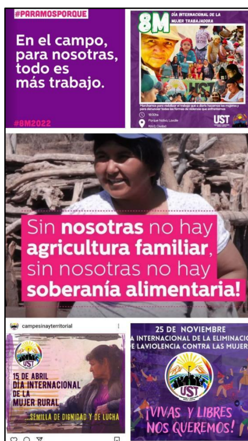
Imagen 3. Capturas de pantalla tomadas de la página de Instagram de la organización @campesinayterritorial de publicaciones vinculadas a su lucha feminista.

Es preciso aclarar que las observaciones anteriormente mencionadas no son inocentes ni neutrales; sino que se encuentran atravesadas y empapadas de la mirada ecofeminista que nutre este estudio y que me es significativo identificar y visibilizar con el afán de darle lugar al rol que poseen estas mujeres. Pero también de poner sobre la mesa los lentes personales con los que entré en contacto con ellas y con los que analizo lo surgido en nuestros intercambios. Lentes que es preciso asumir para evitar que estas decisiones se difuminen, parezcan ser producidas por el azar y no sean fundamentadas.