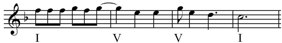
Figura 1: El Chupino

Esta construcción contrasta con el icono Carlos Montbrun Ocampo Compositor referente de los cultores actuales, cuyas composiciones están basadas en las estructuras más estandarizadas de los géneros cuyanos, especialmente en los aspectos melódicos y armónicos. La mayoría de sus canciones están construidas a partir de combinaciones de tónica y dominante; gran parte de ellas enteramente compuestas desde el módulo armónico \parallel I \mid V \mid V \mid I \parallel siempre en el modo mayor 8 , como el gato cuyano El chupino (Fig. 1).