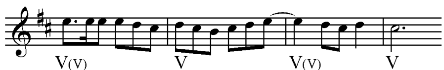
Figura 2: Las dos puntas

La situación armónica que más se aparta del plan estrictamente diatónico consiste en el empleo de dominantes secundarias, recurso que aparece con bastante frecuencia en las músicas cuyanas de base tradicional. Por ejemplo, en la cueca Las dos puntas el módulo utilizado en el estribillo es \parallel V7(v) \mid V \mid V7(v) \mid V \parallel (Fig. 2).