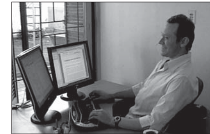
Figura 5 Puesto de trabajo en oficina

El producto de la investigación consiste en una guía para evaluación de confort en postura sedente. La misma consta de cuatro instru-