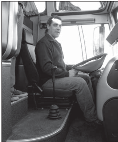
Figura 4 Puestos de conducción en camiones y ómnibus

El material y la estructura con la cual tiene contacto el usuario deben favorecer la distribución adecuada de presiones según las zonas