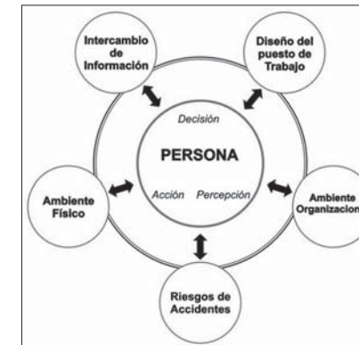
Figura 2 Modelo gráfico de las interacciones en el sistema de trabajo

La Ergonomía es una disciplina del campo científico-tecnológico cuyo propósito es el estudio de las relaciones de las personas con los sistemas con que éstas interactúan a fin de optimizarlas. Este campo del conocimiento es conceptualizado como la tecnología de la comunicación en los sistemas hombres-máquinas (SHM) (Montmollin, M. de, 1971).