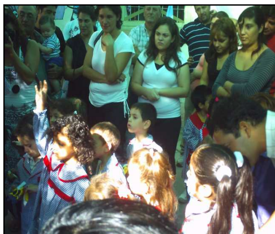
Imagen 16. Alumnos y madres de la Escuela Formosa

Imagen tomada durante el trabajo de campo, 2013.