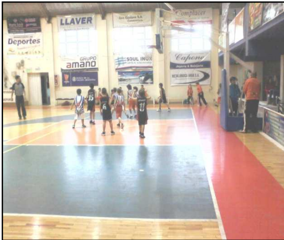
Imágenes 8 y 9. Instituciones (Zona Urbana), Rivadavia, Mendoza

Imagen tomada durante el trabajo de campo, 2013.