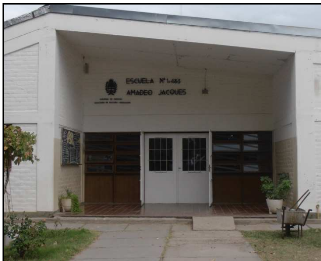
Imagen 1. Escuela Amadeo Jacques, Departamento de Rivadavia, Provincia de Mendoza

Fuente: elaboración propia. Imagen tomada durante el trabajo de campo, 2013.