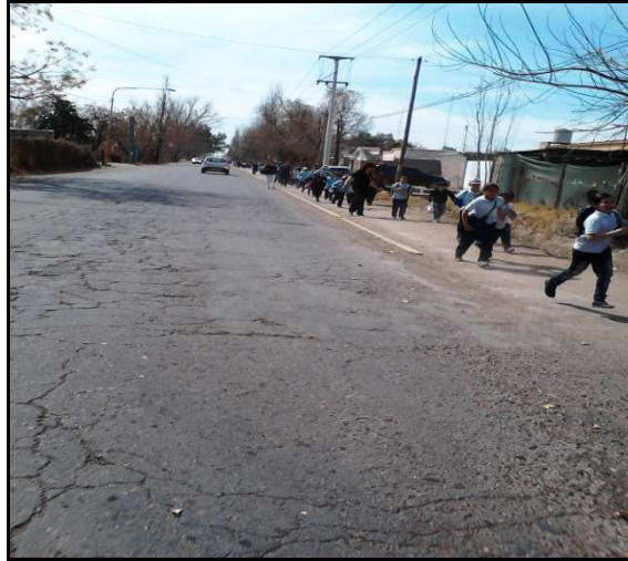
Imagen 7. Calle Comandante Torres (Zona Urbana), Rivadavia, Mendoza

Fuente: elaboración propia. Imagen tomada durante el trabajo de campo, 2013.