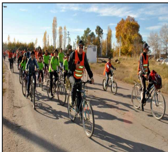
Imagen 12. Alumnos de la Escuela Amadeo Jacques y miembros de la comunidad

Fuente: elaboración propia. Imagen tomada durante el trabajo de campo, 2013.