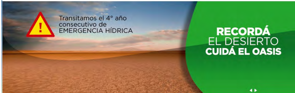
Figura 5. Difusión institucional del cuarto año consecutivo de “emergencia hídrica”. 2013.

Tunuyán, y el quinto año consecutivo para la cuenca del río Atuel (Decreto 2.090/2013).