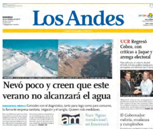
Figura 6. El vínculo escasez de nevadas-escasez de agua

La comprensión institucional de la problemática como una escasez fabricada (Swyngedouw, 2004), como un flagelo residente en la naturaleza, encuentra su eco en los medios de comunicación locales, más aún, a inicios del equinoccio de primavera. De esta forma, se reproduce la idea unidimensional de que la escasez de agua se puede entender sólo en términos de escasez de nevadas (Figura 6).