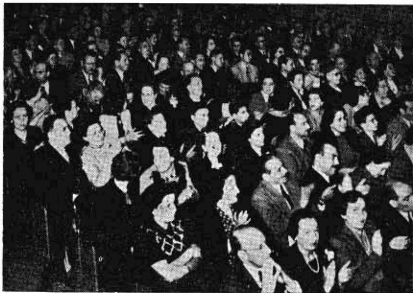
Aspecto parcial del público que colma habitualmente la Sala del Teatro In- dependencia con motivo de los Conciertos de la Orquesta Sinfónica de la Universidad Nacional de Cuyo, Mendoza.